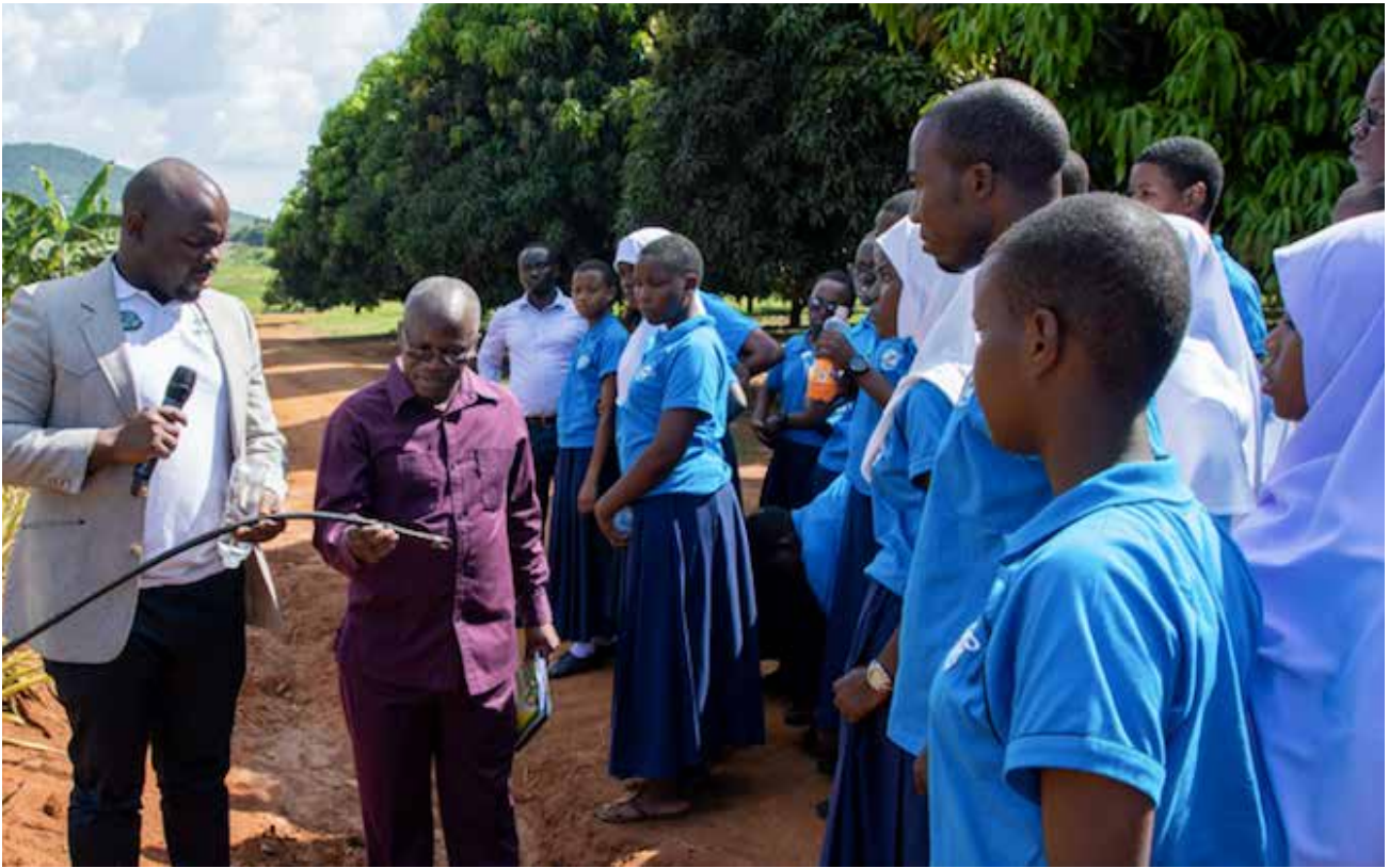
Wanafunzi wa shule ya Sekondari ya Wasichana Kilakala, Morogoro wakipatiwa maelezo kuhusu kilimo cha mboga kidijitali walipotembelea Chuo Kikuu cha Kilimo cha Sokoine (SUA) kama sehemu ya maadhimisho ya Siku hiyo.