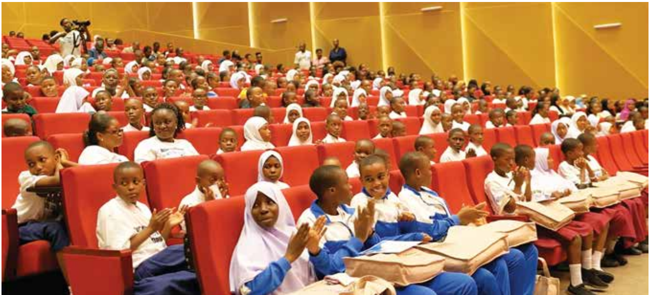
Wanafunzi wa shule mbalimbali za wasichana mjini Dar es Salaam wakiwa kwenye ukumbi wa Chuo Kikuu cha Dar Es Salaam kwa maadhimisho.